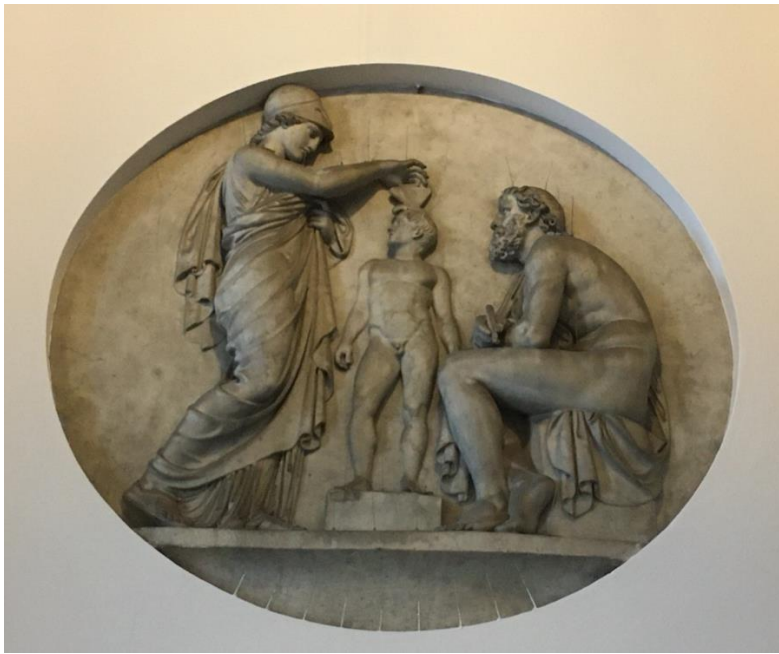
Minerva giver sjæl til mennesket i form af en sommerfugl, mens Prometheus ser til.