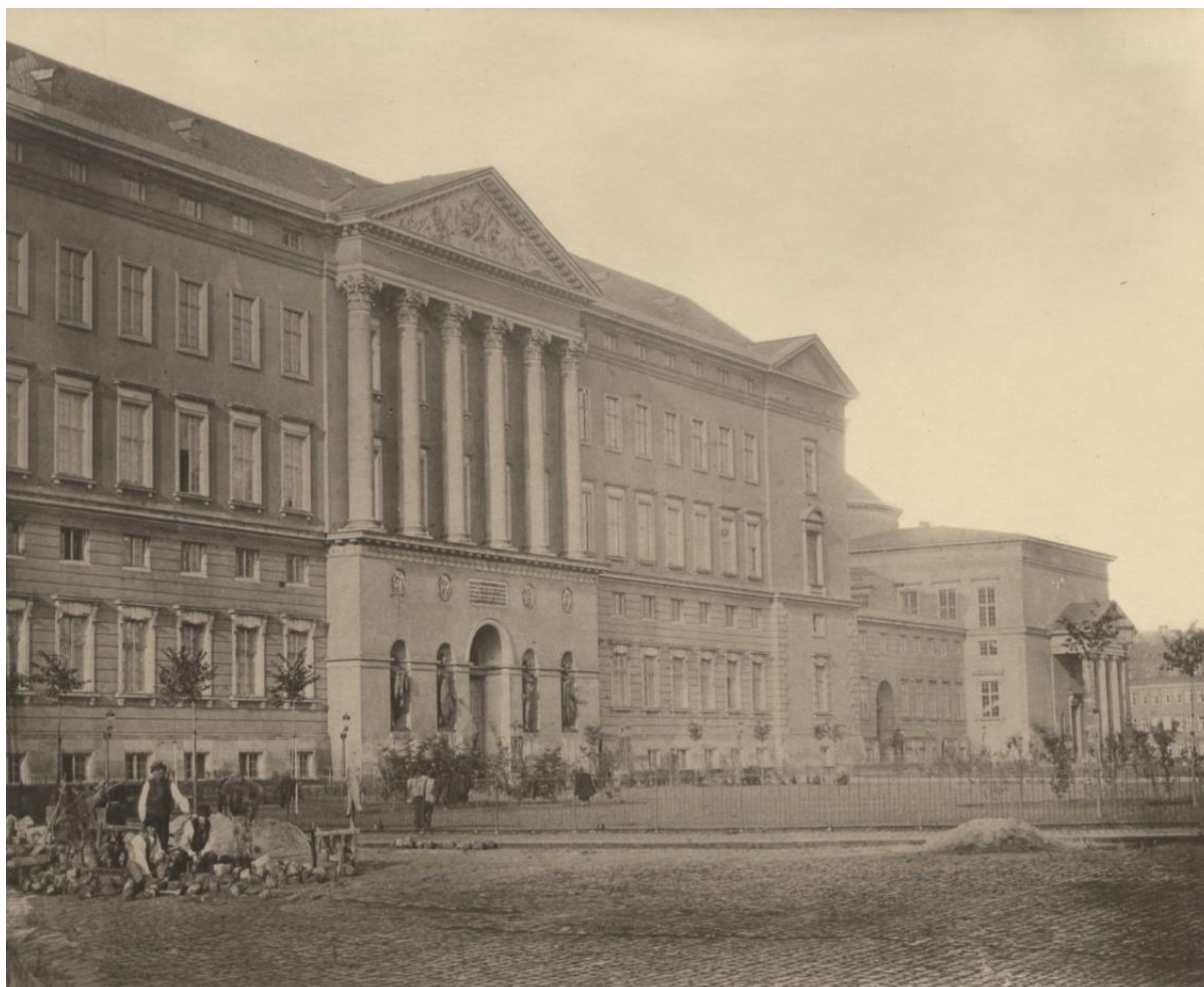
C. F. Hansens Christiansborg slot, hvor der i den centrale facade ses fire skulpturer og herover fire medaljoner

En ulykke kommer sjældent alene. København bliver fra sidst i 1700-tallet ramt af en række katastrofer. I 1794 brænder Christiansborg slot, i 1795 oplever københavnernes byens anden store bybrand, og i 1807 bliver landets hovedstad udsat for englændernes bombardement. Efterfølgende skulle store dele af København genopbygges, og en af danmarkshistoriens mest fremtrædende og indflydelsesrige arkitekter C. F. Hansen står for genopbygningen af adskillige af byens mest markante bygninger, heriblandt Christiansborg slot. C.F. Hansens stil er klassisk og er hans fortolkning af Romerrigets magtfulde arkitektur.