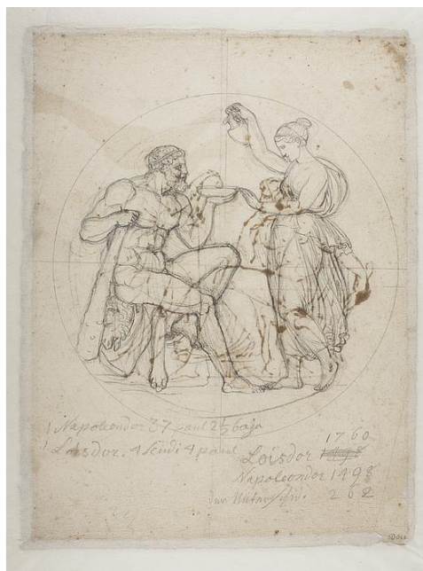
Thorvaldsens skitse til Herkules og Hebe

Det allegoriske tema for såvel skulpturerne og medaljonerne skal være: Retfærdighed, Sandhed, Klogskab og Styrke. Midt i februar 1807 takker Thorvaldsen for bestillingen og foreslår, at motiverne tages fra den græske mytologi. Siden 1783 har den danske arkæolog Georg Zoega boet i Rom, og af ham lærer Thorvaldsen umådelig meget. Zoega er ellers ikke imponeret over Thorvaldsen ved ankomsten til Rom, hvor han i et brev til en ven skrev: ” .... Vor Landsmand, Thorvaldsen, som tilbringer otte Dage her hos mig, for at besøge Mærkværdighederne af dette Nabolag, er en fortræffelig Artist af megen Smag og Følelse, men alt for uvidende i Alt, hvad er udenfor Konsten. Incidenter sagt, er det meget ilde overlact af Academiet, at de sende Folk saa ganske raae til Italien, hvor de siden maa tabe en Mangfoldighed af Tid med at lære Ting, uden hvilke de ei tilbørligen kan nytte deres Ophold her, og som de lettere og snarere kunne have lært, førend de begav sig paa Reisen. Uden at vide et Ord Italiensk eller Fransk, uden den ringeste Kundskab om Historie og Mythologie, hvorledes er det muligt, at en Kunstner studerer her, som han burde? ....”