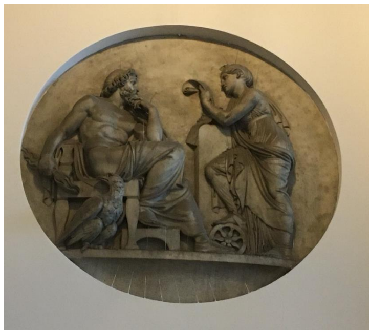
Thorvaldsens relief af Jupiter og Nemesis

Måske søger Thorvaldsen hjælp hos sin enestående ven og vejleder Zoega med den ikonografiske udformning af reliefferne, som bliver modelleret i årene 1808-10, og hvor kunstneren i hvert tilfælde vælger et mytologisk par, der samtidig skal uddybe de planlagte skulpturers symbolindhold. Klogskab bliver illustreret med Miverva og Prometheus, hvor han som en billedhugger har skabt det første menneske i ler, mens gudinden indgiver mennesket bevidsthed eller sjæl i form af en sommerfugl, som hun sætter på dets hoved. Styrken bliver illustreret med Herkules der modtager udødelighedens drik af Hebe. Herkules kendes på køllen og det løveskind, som han sidder på; engang havde han nemlig kvalt en løve med de bare næver. Sundhed – en læsefejl sneg sig ind undervejs, hvorved at sandhed bliver til sundhed – bliver fremstillet som lægeguden Æskulap og hans datter, Hygieia, der som