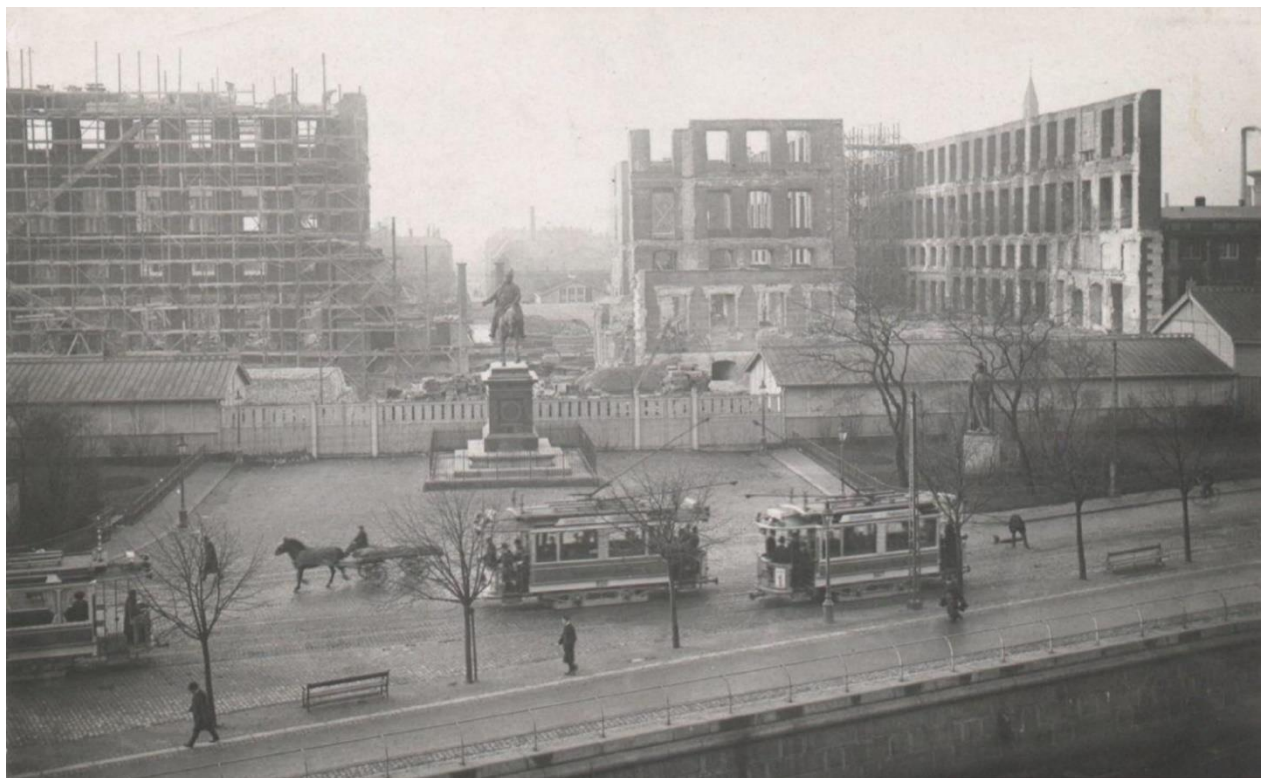
Nedrivningen af C. F. Hansens Christiansborg slot er i gang. I forgrunden til højre ses skulpturen af Æskulap, som er midlertidigt placeret i haven.