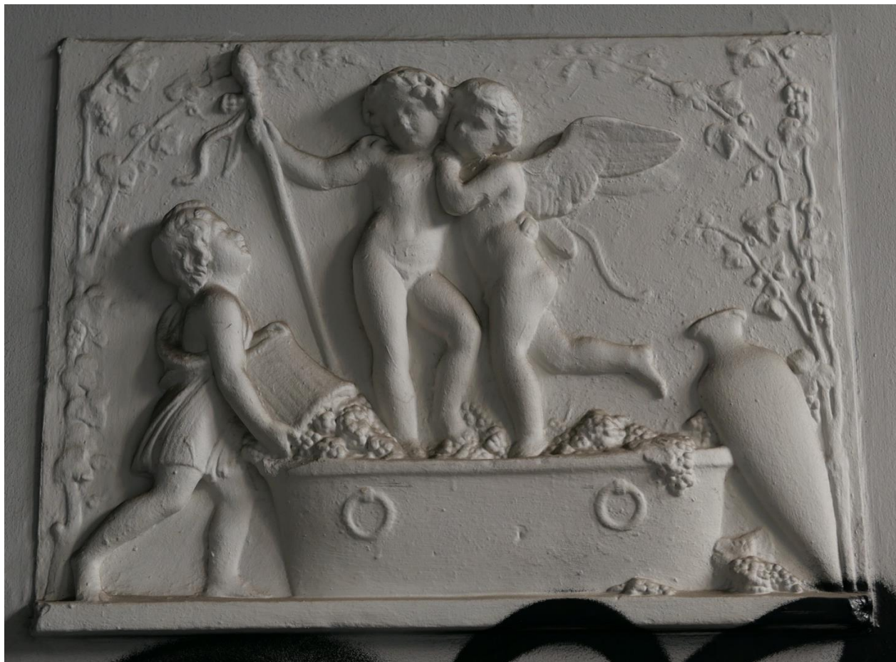
Kopi af Amor og Bacchus, høsten, som er opsat i en port i Skindergade

I august 1837 underskriver Thorvaldsen et testamente, hvori han skænker sin samling til sin fødeby København, og kort tid efter nedsættes en komité til oprettelsen af et Thorvaldsens Museum. Allerede året efter påtænker denne komité, at der kan opnås indtægter til museet ved, at der udføres kopier og afstøbninger af Thorvaldsens plastiske arbejder og efter at disse er forsynede med et eget stempel og mærke. Hensigten er dog ikke kun økonomisk, men også ”... et Middel til at bringe de Thorvaldsenske Arbejder ud iblandt Folket og derved oplive Kunstsandsen” – en holdning, som Thorvaldsen selv bifalder.