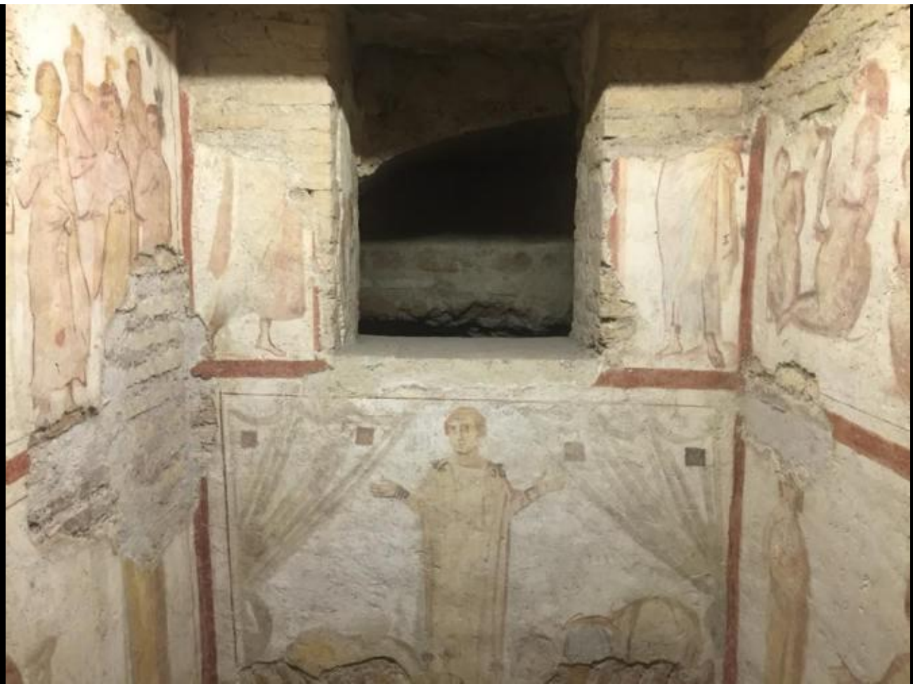
Fresker i andagtsrummet i et af Case Romane del Celio. Relikvierne efter de to lokale martyrer Johannes og Paulus skal have været opbevaret bag åbningen. Fresken viser centralt en person i bedestilling, og på hver side af ham de to lokale martyrer.

Da Constantius II døde i 361, blev han efterfulgt af Julian Apostata (den frafaldne). Julian var opdraget i den kristne tro, men var glødende nyplatoniker og Mithras-dyrker, og da han blev kejser, gjorde han alt for at udslutte kristendommen og vende tilbage til de gode gamle dage. Johannes og Paulus blev kaldt tilbage til hoffet og pålagt at afsværge deres kristne tro, hvilket de nægtede. Eller også havde de omvendt en romerske general til kristendommen. I hvert fald blev de dømt til døden. En mand ved navn Terentian eksekverede dødsdommen i Johannes' og Paulus' eget hus på Monte Celio. Terentian konverterede senere til kristendommen og nedskrev fortællingen om de to martyrer. (Bemærk ligheden med Saul/Paulus' omvendelse).