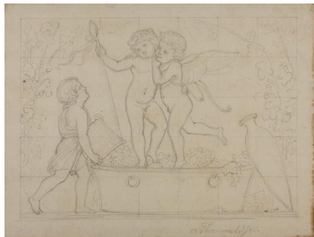
Et par af skitserne udført i 1810 i Rom

På relieffet fra Thorvaldsens hånd er et stort kar fyldt med høstede drueklaser, og i disse stamper den vingede Amor druerne sammen med Bacchus, der om hovedet har en krans af efeu og druer. En dreng hælder flere druer op i karret, mens der ved karrets modsatte ende er en amfora. Langs relieffets kanter er vinstokke med drueklaser.