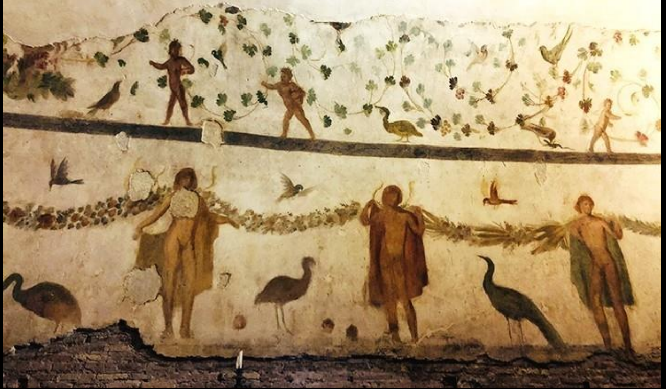
Freske fra loft i et af de romerske huse med paradisiske billeder med fugle og blomsterranker. Klassiske antikke billeder, der i tidlig kristen sammenhæng blev læst som billeder fra Paradis, og påfuglen som opstandelsessymbol.

Selve kirken Santi Giovanni e Paolo ligger, hvor der oprindeligt var et tempel for den guddommeliggjorte kejser Claudius. Templets facade havde 8 søjler og var vendt mod Monte Palatino. Omkring 400 blev der bygget en kirke i form af en basilika på stedet. Men den led stor skade først under goternes hærgen i byen, siden af et jordskælv og til sidst normannernes hærgen. Der blev atter bygget en kirke på stedet i flere omgange fra ca. 1000 og frem. Fundamenterne fra titulus-bygningen blev anvendt som grundlag for kirken. Og facaden har stadig 8 søjler. Campanilen er fra 1150, og fresken i apsis med den tronende Kristus er i manieristisk stil fra 1588.