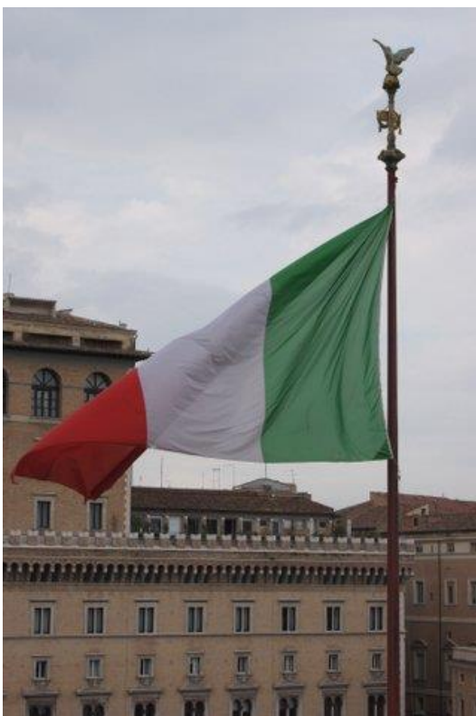
Trikoloren fotograferet fra Fædrelandets Alter mod Piazza Venezia.

Foran to meget høje flagstænger med det italienske flag Trikoloren – la Bandiera d’Italia. På en forårsdag får en stille brise de kæmpestore flag i florlet flagdug til at rejse sig. Enkle, med klare skarpe farver i relief mod omgivelsernes støvede nuancer.