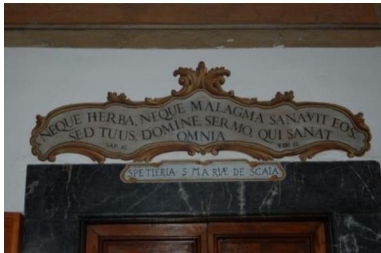
Hverken urt eller omslag helbreder. Men Herre dit ord helbreder alt

Blandt de mest berømte galeniske produkter var Theriak, der siden 100-tallet evt. har været anvendt mod alskens sygdomme, som fx slangebid, forgiftning, pest og andre alvorlige lidelser. Theriak indeholdt mange forskellige ingredienser bl.a. hugormekød, rabarber, aloe, myrrha og safran opløst i honning og vin. Og selvom der i Pavernes Apotek er en indskrift, der siger: 'Hverken urt eller omslag helbreder, men Herre, dit ord helbreder alt', var der nu også 1% opium i blandingen. Andre berømmede produkter var 'Vandet fra trappen' ('l'Aqua della Scala'), der anvendtes mod luftvejslidelser, reumatisme og allergi, samt det beroligende l'Aqua di Melissa og endeligt Samaritanerindens Vand, der virkede desinficerende. Også i Danmark blev der dyrket lægeurter i klosterhaver, og klostre har været involveret i pleje af syge. I sammenhængen er det interessant, at Theriak blev solgt på danske apoteker helt frem til omkring 1. verdenskrig. Melissa-vand kan stadig købes rundt omkring i hvert fald ifølge internettet i Italien. Og der er stadig flere steder apoteker i forbindelse med klostre og kirker, fx ved San Paolo fuori le Mura. Her kan man ofte købe lokalt fremstillede likører.