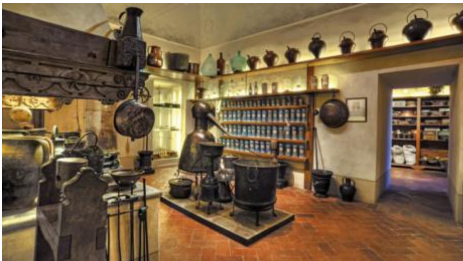
Destillations-apparat, mortere, kogekar, præcisionsvægte, kolber, glas mm. brugt til fremstilling og opbevaring af medicin udstillet i de oprindelige lokaler, nu apotekets museum

Bølgen med alternativ medicin i Vesteuropa tog fart omkring 1970, altså kort efter at man holdt op med at fremstille produkter af urter i Pavernes Apotek. I danske apoteker foregik der lokal fremstilling af miksturer, tabletter, salver, pulvere mm. helt op 1970-80, inden industrialiseringen tog næsten helt over, ikke mindst fordi kravene til produktionen blevet skærpet.