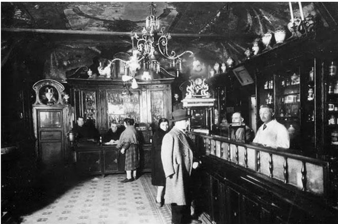
Interiør fra apoteket med de klassiske og paneler, skabe, keramik-krukker og glas til opbevaring af medicin, salver og ekstrakter (Årstal ukendt)

På apoteket fremstilledes galeniske produkter, mest bestående af urter eller ekstrakter (deraf navnet 'spezieria' dvs. krydderi-butik). Det er en fortsættelse af den ældgamle tradition, som den græske læge Galen grundlagde 3. - 2. århundrede fvt. Lægeurterne blev dyrket i klostrets have, og fremstillingen af galeniske lægemidler i form af miksturer, ekstrakter, salver, piller mm. fortsatte helt frem til efter 2. verdenskrig. Apotekets munke blev anset for super-specialister i arbejdet med urter, og både munke og lægmænd blev undervist i faget på apoteket. Undervisningen er fastholdt i et maleri fra 1700-tallet i apotekets atrium, hvor man ser munken Fra Basilio della Concezione (Broder Basilius fra Undfangelsen) undervise.