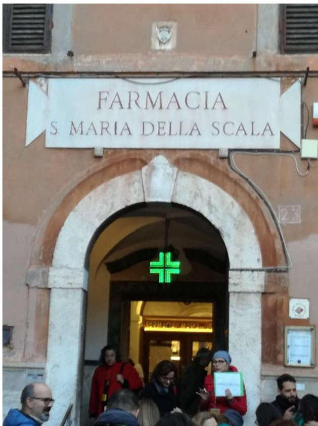
Indgang til Pavernes Apotek

På apoteket fremstilledes galeniske produkter, mest bestående af urter eller ekstrakter (deraf navnet 'spezieria' dvs. krydderi-butik). Det er en fortsættelse af den ældgamle tradition, som den græske læge Galen grundlagde 3. - 2. århundrede fvt. Lægeurterne blev dyrket i klostrets have, og fremstillingen af galeniske lægemidler i form af miksturer, ekstrakter, salver, piller mm. fortsatte helt frem til efter 2. verdenskrig. Apotekets munke blev anset for super-specialister i arbejdet med urter, og både munke og lægmænd blev undervist i faget på apoteket. Undervisningen er fastholdt i et maleri fra 1700-tallet i apotekets atrium, hvor man ser munken Fra Basilio della Concezione (Broder Basilius fra Undfangelsen) undervise.