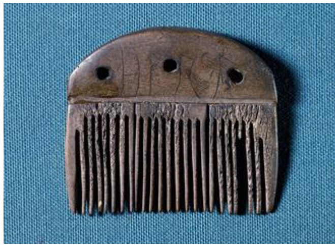
Kam fra Viemose med de ældste kendte runer fra 1. årh. e.v.t.

Lad os blive lidt i det sproglige hjørne. Vores forfædre har helt givet fået inspirationen til deres runealfabet, Futhark, sydfra. Den ældste kendte runeskrift i hele verden er fra et dansk fund fra ca. 150 e.v.t. ved Viemose på Fyn. Det drejer sig om en kam af ben med indskriften harja , måske et navn eller ordet 'kam'. Futhark består af enkelte bogstaver nogle med tilsyneladende lån fra det latinske, nogle fra det græske og nogle fra det etruskiske alfabet. Men nogle af bogstavernes lyde er baseret på det oldnordiske sprog og er uden sammenhæng med forbillederne. Nyere forskning peger på, at runealfabetet er en imponerende nordisk, selvstændig frembringelse, der må have stillet endog meget store krav til viden om sprog, lyde og grammatik. Og det i en verden fuldstændig uden eksisterende skriftlig tradition. Man mener, at kun ganske få i begyndelsen har været i stand til at skrive og læse runerne, der muligvis har været tillagt en magisk kraft. Ikke mindst de mange runesten sat senere som minder over afdøde kan have haft en religiøs betydning. Men runeskrift i forskellige udgaver blev faktisk brugt som daglig skrift helt frem til ca. 1200 e.v.t.