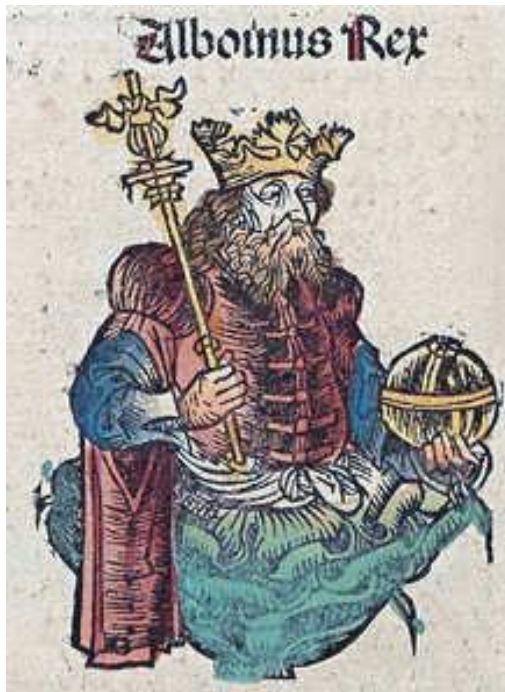
Alboin, langobardisk konge, der i 568 anførte sit folk under invasionen af Italien. Han har behørigt langt skæg, som traditionen siger, langobarderne havde. Miniature fra Schedel's Krønike (også kaldet Nürnberg Krøniken) fra 1493

sammenstød. Slutteligt, så sent som i 868 og igen i 878 plyndrede langobardiske tropper i Rom.