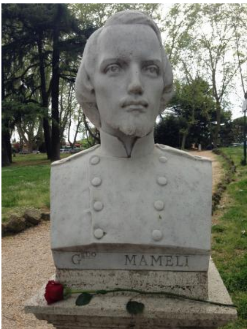
Goffredo Mameli dei Mannelli, 1827 – 1849 Buste i Heltenes Park, Gianicolo, Rom