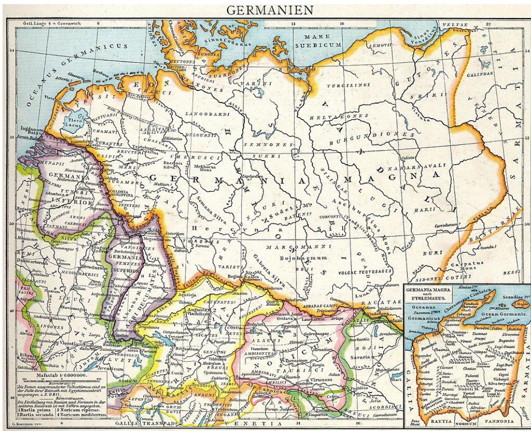
Kort over 'Germania Magna' d.v.s. Stor-Germanien øst for Rhinen, nord for Donau og vest for Wisla i Polen. Mod nord er de danske øer inkluderet. Ca. 1. århundrede e.v.t. I figuren til højre er vist Ptolemaeus' kort fra 2. årh. e.v.t.