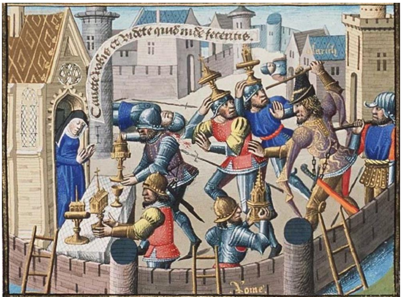
Alariks og visi-goternes plyndring af Rom 410 e.v.t. De våbenløse indbyggere forsøger at skjule hellige genstande for visi-goterne. Men får prygl af Alarik. Han selv er vist med mønstret rustning og sort hat efter datidens burgundiske mode. Miniature fra 1475 i Raoul de Presles' (1371-1375) oversættelse til fransk af kirkefaderen St. Augustins værk fra 413-426 De civitate Dei contra Paganos (d.v.s. 'Om Guds By mod hedningerne')

Visi-goterne derimod flygtede fra hunnerne sydpå ind i Romerriget og fik i første omgang også lov til at være syd for Donau, hvor romerne mente, de kunne være et værn netop mod hunnerne. Goterne var på vejen blevet kristne, om end af den retning, der kaldes for arianere efter den præst, Arius, som havde udformet deres troslære. Men romerne var ikke glade for de arianske kristne, der ikke troede på treenigheden og dermed på, at Kristus er sidestillet med Gud. Arianerne blev derfor betragtede som kættere af den katolske kirke, så goterne fik ikke lov til at bosætte sig permanent i Romerriget, og de sultede. Til sidst gjorde de oprør og vandrede ned over Balkan og videre mod Italien og helt til Rom under ledelse af deres konge Alarik. Efter flere belejringer af Rom og forsøg på fredsforhandlinger afslog senatet at betale beskyttelsespenge, hvorefter visi-goterne indtog byen år 410 e.v.t. På dette tidspunkt var den øst-romerske hovedstad blevet flyttet til Ravenna. Men Rom blev stadig betragtet som rigets hjerte. Visi-goterne gik da også efter Roms symbolsk vigtigste bygning: senatet, som de brændte ned, måske som en slags reprimande. Og de stjal, men opførte sig faktisk ellers fredeligt i sammenhængen. Og besættelsen af byen var kortvarig. Alarik døde kort tid efter, og visi-goterne trak sig ind i Gallien og videre til Spanien, hvorfra de forsvandt ud af historien, da de senere blev besejret af maurerne helt fremme i det 8. århundrede.