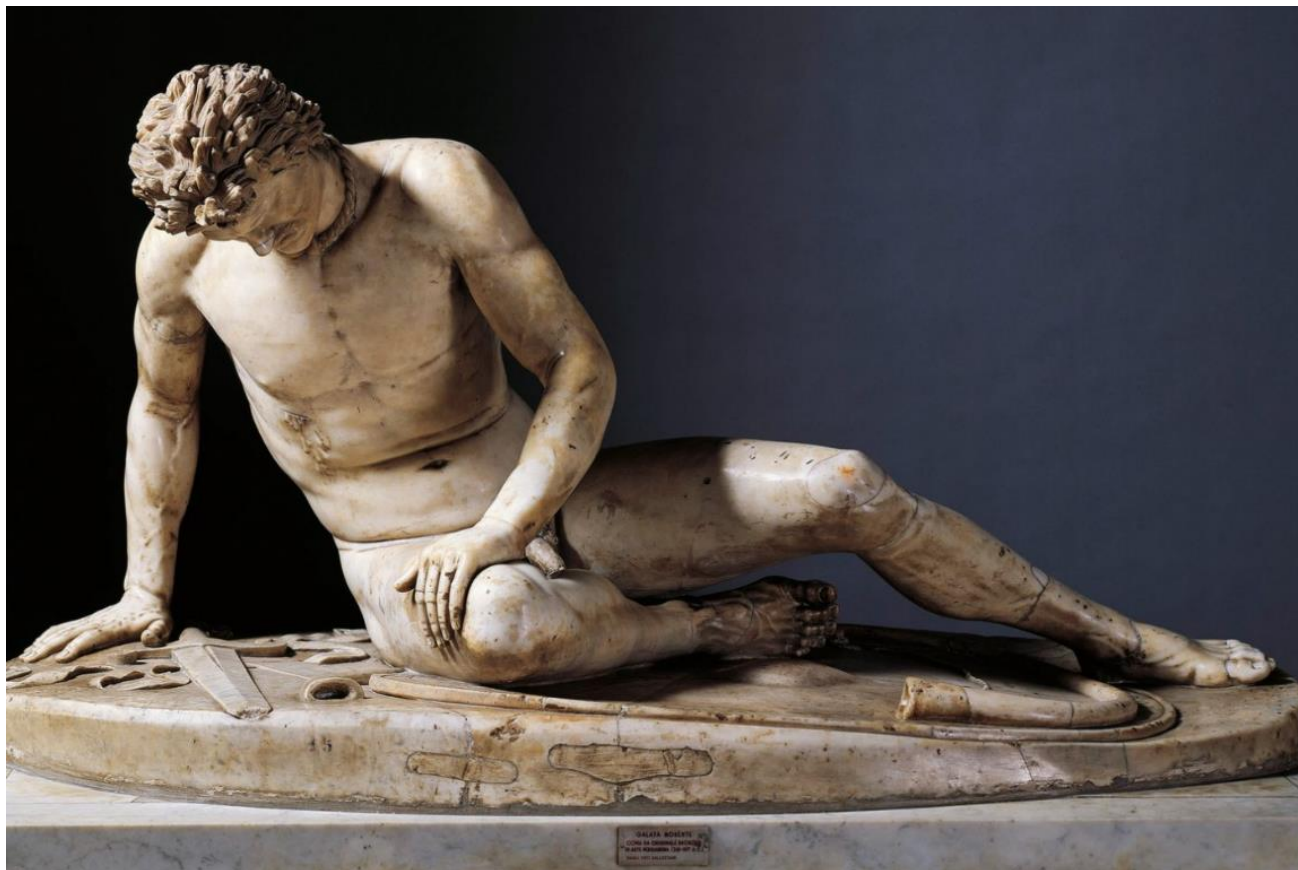
Den døende galler. Romersk kopi af skulptur fra Pergamon fra 3. årh. f.v.t. Nu i Capitol-museet i Rom. Kan i øvrigt ses i bronzekopi i Ørstedsparken i København

Vi ved overhovedet ikke, hvor disse folk stammede fra, endsige om Jylland kunne være stedet, og romerne anså dem nok for igen at være en art gallere. De kom for at blive fastboende romere. For der er gode grunde til at tro, at bølgerne af angreb skyldtes behov for jord og mad, for det bad kimbjerne og teutonerne faktisk om. Uro langt bort fra Romerrigets grænser satte gang i en dominoeffekt, som sammen med rygterne om romernes rigdom fik folk til at bryde op og kaste sig ud i kamp. Og slås, det kunne de, hylende og skrigende og opildnet af deres hujende kvinder bag mændenes udisciplinerede horder. Det gav mange nederlag til de tungt manøvrerende romerske hære, indtil feltherren Marius, som først lige skulle besejre kong Jugurtha i Nordafrika, kom hjem, indførte lettere bevægelighed i det romerske fodfolk, og nedslagtede alle totalt i henholdsvis 102 f.v.t. ved det nuværende Aix-en-Provence i Frankrig og så igen året efter på Po-sletten i Norditalien. De besejredes knogler blev brugt til hegn om de lokale vinmarker, siges det.