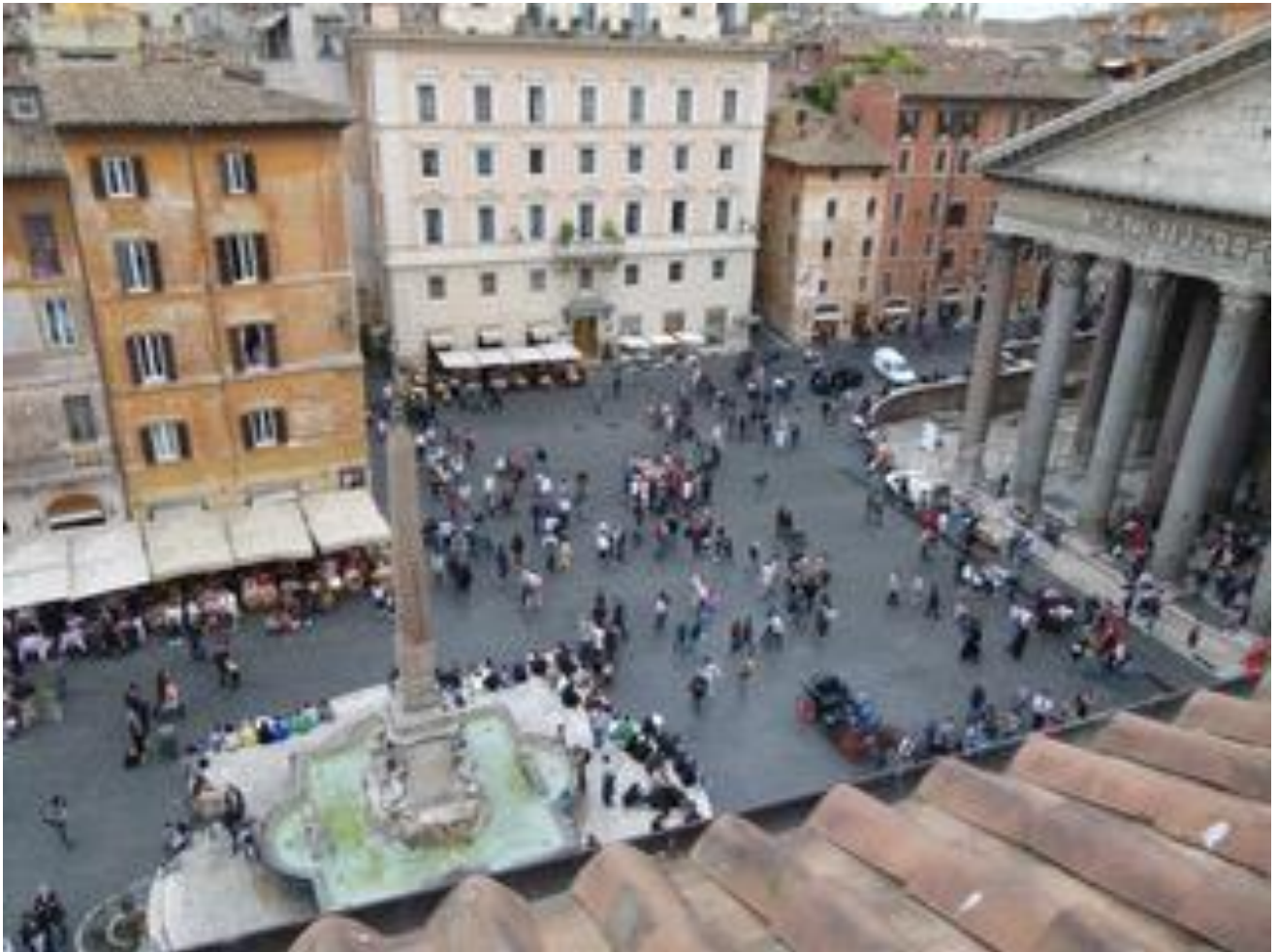
Pantheon med fontæne og obelisk. Den hvide bygning er Hotel Senato.