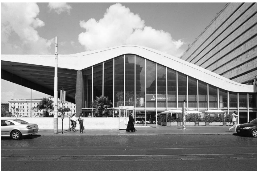
Stazione Termini, Rom

Dem man rejste med havde primus, tekande og proviant med, som blev delt gavmildt ud og et socialt liv udfoldede sig. Der blev spist bayerske pølser på München banegård, men højdepunktet, i mere end en forstand, var at nå op til Brennerpasset, hvor der kunne købes chiantivin i de berømte bastflasker og oste, pølser og skinke med store runde nybagte brød til. Fra Brenner var der så ca. en dagsrejse ned over Posletten til man til sidst kunne se Peterskirkens kuppel i det fjerne og følge Tiberens snoede løb langs skinnerne frem til Stazione Termini i centrum af Rom.