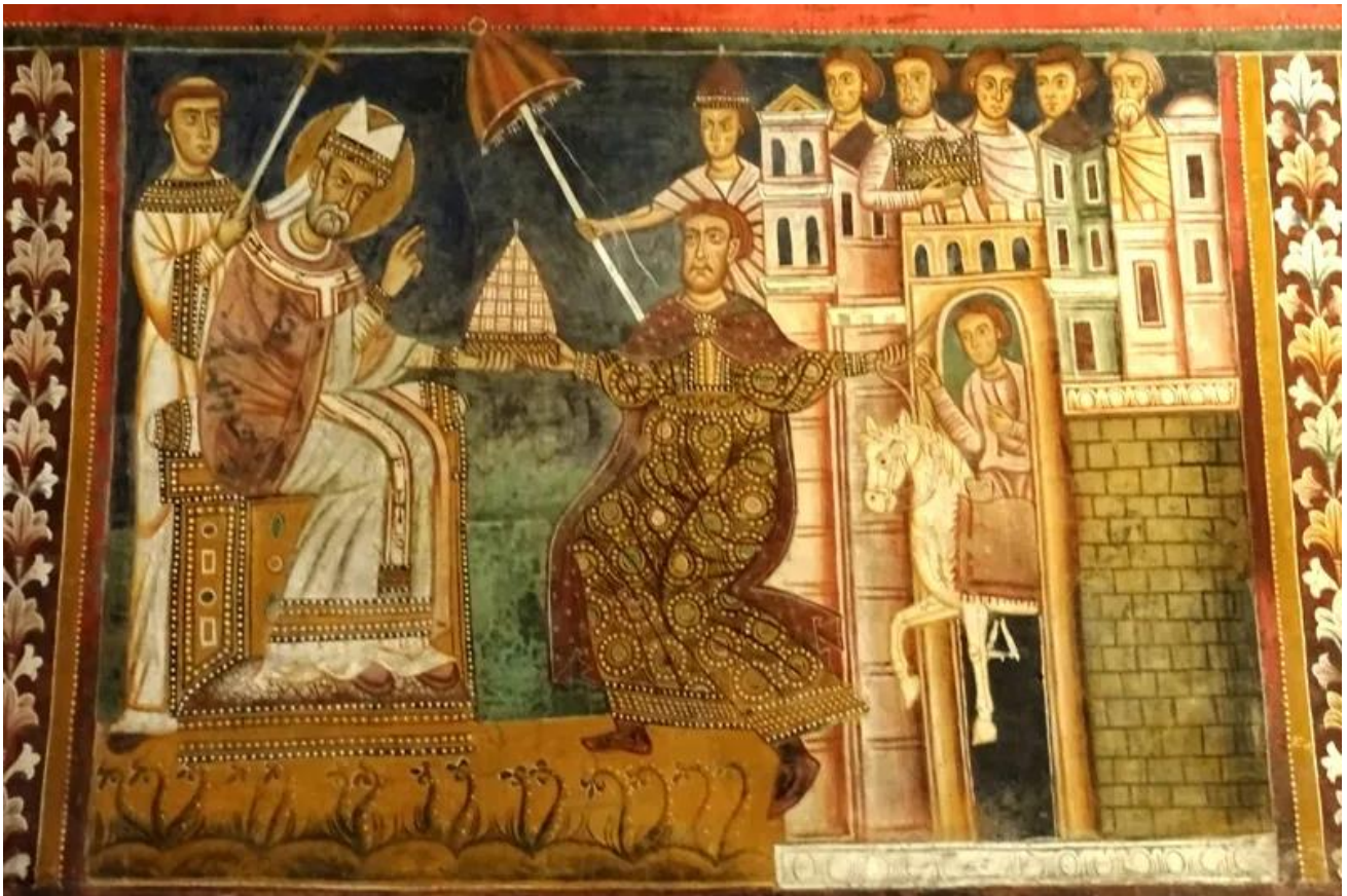
Det konstantinske Gavebrev, Donatio Constantini: Kejser Konstantin overrækker tiaraen og den rituelle skærm (sinichio), symboler på den verdslige magt, til pave Sylvester. Paven bærer i forvejen mitraen, symbolet på den kirkelige magt, på hovedet. Kejseren er placeret en hovedhøjde under paven, gør et halvt knæfald og er uden sin kejserkrone. Den holdes i diskret afstand af en hjælper oppe på bymuren. Freske i Sylvesters kapel i kirken dei Santi Quattro Coronati fra ca. 1246

Men tiderne skifter, og da langobarderne truede med at invadere Rom i midten af det 8. århundrede, søgte paven Stefan II hjælp hos den frankiske konge Pippin. Stefan salvede Pippin i Saint Denis Klosteret i Paris, og Pippin kvitterede ved at fordrive langobarderne bl.a. fra Ravenna. I 756 gav Pippin paven magt over store dele af Italien, måske påvirket af Det Konstantinske Gavebrev, der formodes forfattet på netop dette tidspunkt. Paven blev territorialfyrste på linje med middelalderens mange andre slags fyrster og stormænd, og indtægterne fra de landområder, der med tiden kom til at udgøre Pavestaten, tilflød paven i Rom. Derved fik paven verdslig magt, og han blev en magtfaktor i Italien på godt og ondt. Men paverne måtte hele tiden indordne sig under de faktiske forhold i jernindustrien, dvs. hvem der havde magten i Vesteuropa, og som kunne tænkes at ville gribe direkte ind i de italienske anliggender. Vigtigt var at udsøge sig den mest fordelagtige allierede på længere sigt. Den frankiske konge- og kejsermagt, den tysk-romerske kejser eller den franske konge? I sammenhængen er det vigtigt at drømme om at genoplive den vesteuropæiske kejsermagt i høj grad trivedes i hvert fald blandt de frankiske og tyske herskere. Dog uden at de dermed var rede til at bekræfte paven i hans krav på overhøjhed over de nationale fyrster. Men forandringen betød en endegyldig afslutning på pavens afhængighed af kejseren i Konstantinopel.