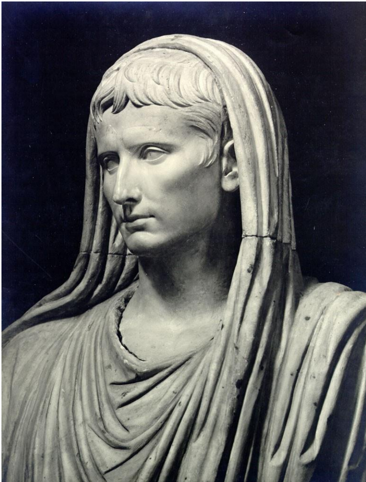
Skulptur af Augustus som Pontifex Maximus fra tiden efter 12 fvt. Statue i Det romerske nationale museum i Palazzo Massimo.

Denne situation fortsatte længe efter, at kristendommen blev tilladt i Romerriget af kejser Konstantin med hans såkaldte tolerance-edikt i år 313 og siden gjort til statsreligion.