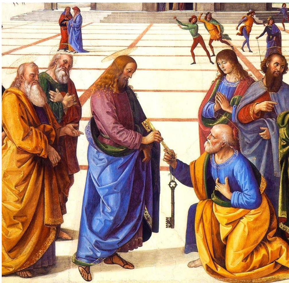
Billede af Jesus, der overrækker Himmerigets nøgler til Peter. Det Sixtinske kapel. Pietro Perugino 1481-82.

De allerfleste kender formentlig beretningen i Mathæus-evangeliet (16;18-19), hvor Jesus dels siger til apostlen Peter, '.. du er Petrus, og på den klippe vil jeg bygge min kirke...', og ydermere, 'Og jeg vil give dig Himmerigets nøgler, og hvad du binder på jorden, det skal være bundet i Himlene, og hvad du løser på jorden, det skal være løst i Himlene...'. Udsagnet er som bekendt baggrunden for, at Sankt Peter traditionelt afbildes med en eller et par nøgler. Herpå grunder sig også pavernes såkaldte nøglemagt som en arv fra Peter såvel som opfattelsen af, at paven er Kristi statholder på jorden, i verdslige som i åndelige sager. Færre ved måske, at 'kirke' som bruges i de nye