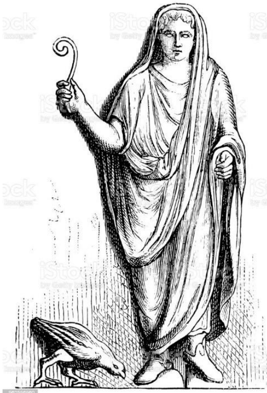
Augur med en lituus, staven, der senere blev til biskoppers hyrdestav. Ved hans fod en fugl. Augurerne tog varsler bla. ud fra fugles flugt. 'Tanti auguri' betyder stadig på italiensk 'held og lykke' eller tillykke

underordnede) Pontifex Maximus, den største pontif eller den øverste præst. Titlen er kendt fra Romerriget og blev allerede brugt fra det sjette/femte århundrede fvt. til at titulere den øverste præst, der forestod en række specifikke hellige ritualer i løbet af året, og som i den forbindelse havde en