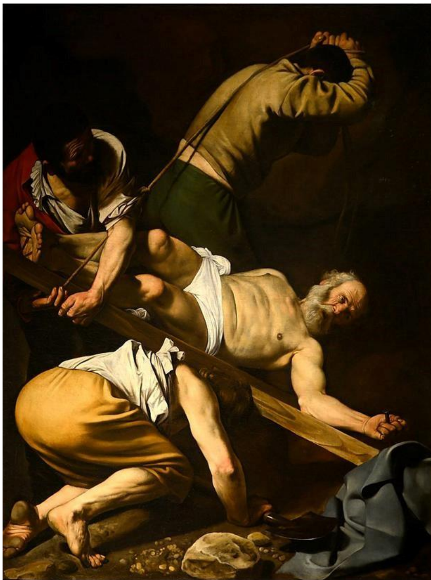
Peters korsfæstelse. Maleri fra 1601 af Caravaggio i Santa Maria del Populo

Det er således ikke helt klart, om Jesus omtaler den senere universelle kirke (sml. dåbsbefalingen efter opstandelsen) eller den lokale jødiske menighed af disciple. Men den katolske kirke opfatter Peter som den første biskop af Rom og dermed også paverækkens nr. 1. I det pavelige segl optræder Peters ansigt side om side med den anden apostelfyrste, nemlig Paulus, og enhver pave bærer den såkaldte 'fiskerring', som henviser til, at Peter ved sin kaldelse var fisker, og til hans rolle som menneskefisker.