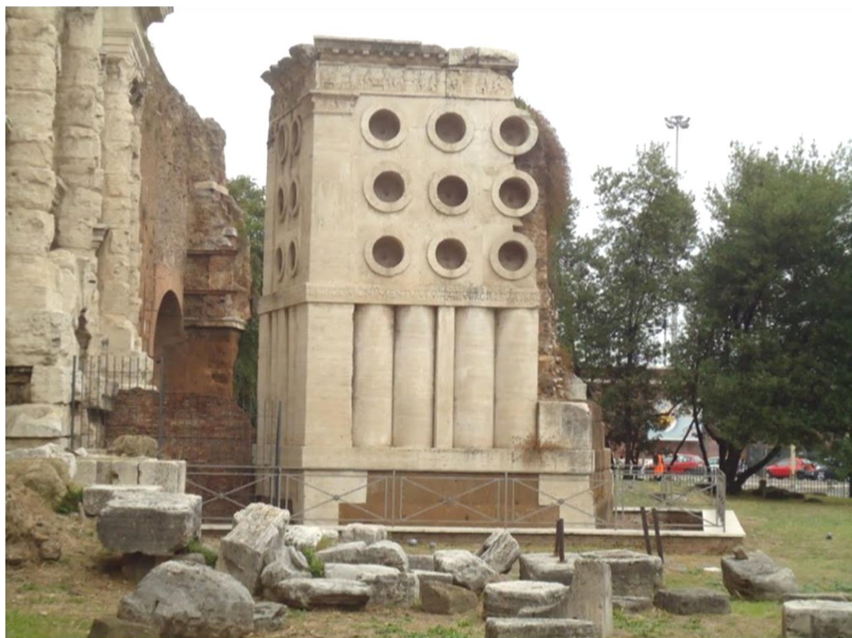
set fra sydvest med nogle af de 26 vertikale og horisontale tromler. Øverst en frise og i midten en inskription. Til venstre et glimt af Porta Maggiore og Aqua Claudia

I den sydøstlige del af Rom nede ved Porta Maggiore ligger et meget specielt monument. Det er højt, 10 meter, meget firkantet at se på med en trapez-formet grundplan og med en masse både lodrette og vandrette rør. Umiddelbart kunne det ligne rester af noget industrielt byggeri fra nyere tid, eller måske noget, som var opført under Mussolinis fascistiske regime, f.eks. i stil med randbebyggelsen på Piazza Augusto Imperatore. Men det er det ikke!