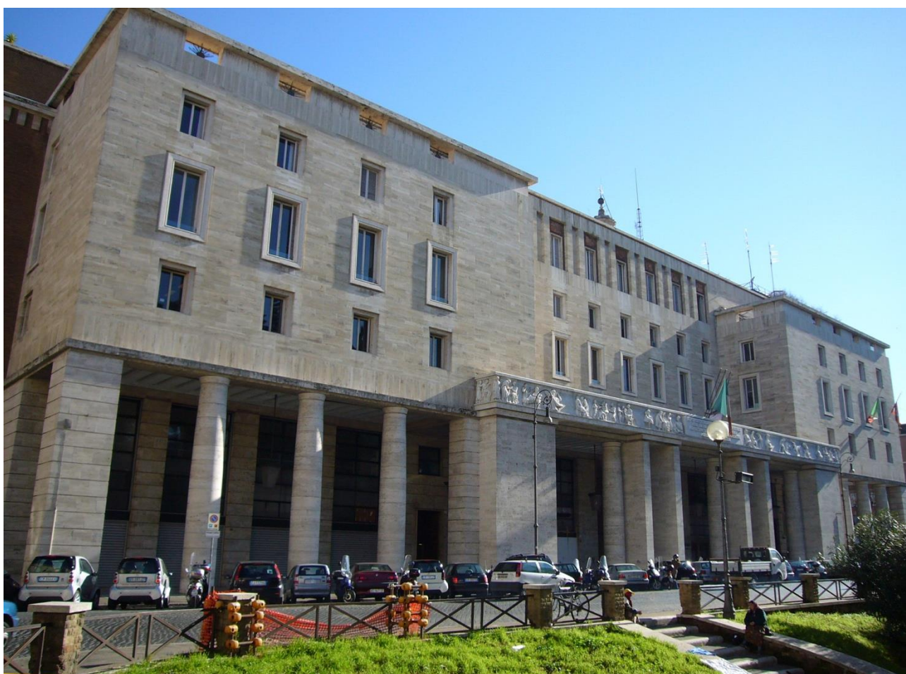
Randbebyggelsen på Piazza Augusto Imperatore, opført 1937-38 til fremhævelse af kejser Augustus mausolæum. Bemærk ligheden med ælte-tromlerne på Eurysaces’ monument med de markerede vinduespartier og vertikale søjler samt den antik-lignende frise

Der er ligefrem rytme i ordlyden, som oversat siger ”Dette monument er bageren og leverandøren Marcus Vergilius Eurysaces’s. Det er klart”. På sydsiden er der en lignende, men kortere og delvist ødelagt inskription, som – umiddelbart påfaldende – har en lidt anden stavemåde, nemlig ”...MARCI VERGILI...”. Der er ikke tale om mangelfulde skolekundskaber eller usikkerhed. Men man har fulgt en ældre stavemåde for nogle af ordene, som først på Augustus’ tid blev ændret i kraft af en retskrivningsreform. Det gælder f.eks. formerne MONIMENTUM for Monumentum, MARCEI VERGILEI for Marci Vergili. Samme tendens ses i en hovedindskrift for Eurysaces’s hustru (se nedenfor).