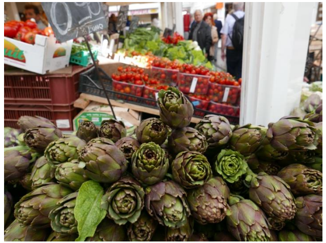
Friske grønsager i ét af Rom's madmarkeder