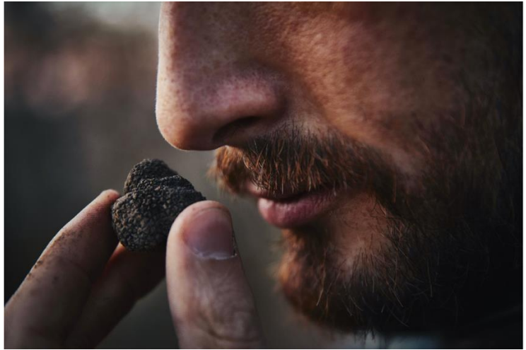
Trøffeljægeren, hunden og manden, samt resultatet