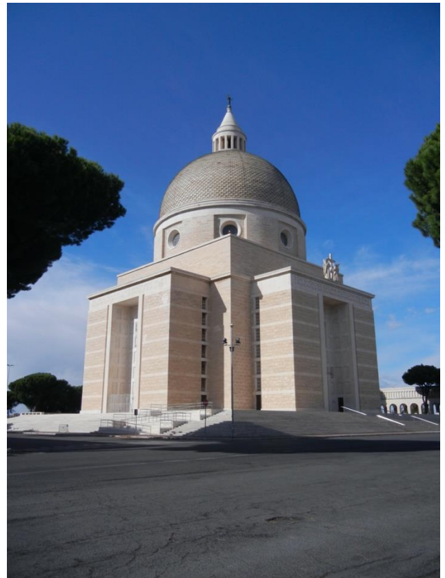
Det firkantede Colosseum samt kirken i EUR