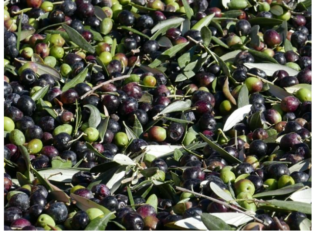
Europa's største oliventræ og frisk olivenhøst