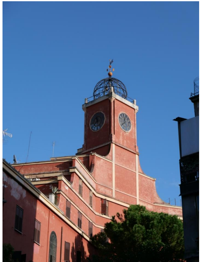
Coppedé-kvarteret og Garbatella-kvarteret