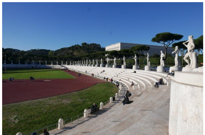
Marmorstadiet og andre sportsanlæg blev bygget under facismen