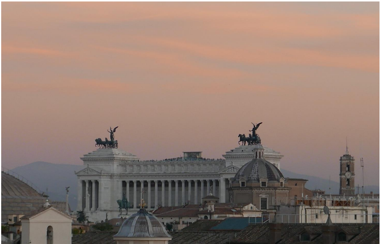
Viktor Emanuel-monumentet er et symbol på Il Risorgimento; Italiens samling

Men også i de seneste årtier er nyt kommet til: Parco Musica og MAXXI til kulturel fornøjelse for hovedstadens beboere.