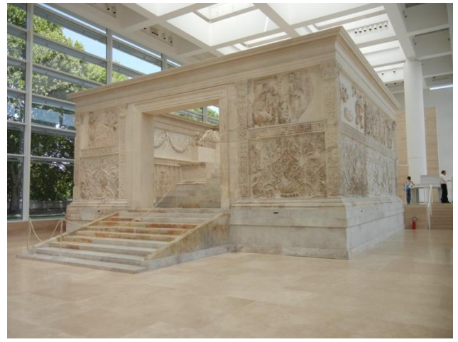
Augustus' mausolæum og Ara Pacis er omgivet af byggeri fra facismen, hvillket giver en tydelig perspektivering mellem antikkens Rom og det Rom, som Mussolini ønskede