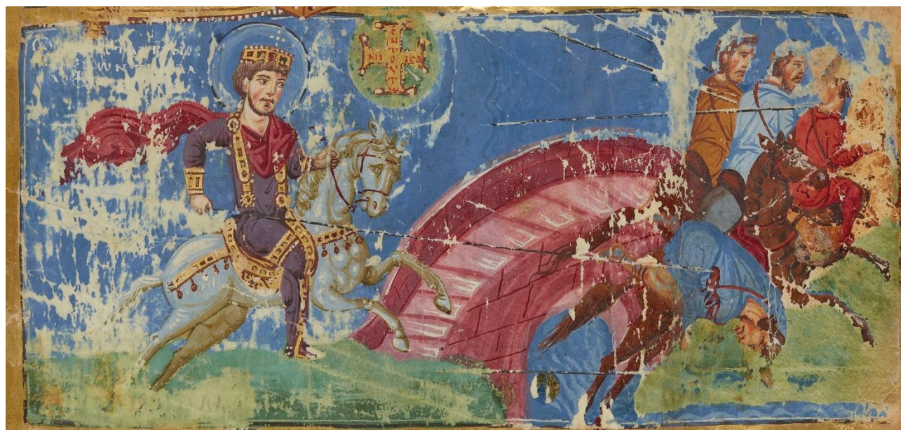
Slaget ved Den milviske Bro i 312. Konstantin ser Maxentius styrte i Tiberen under flugten. Foran og over Konstantin ses et kors med nogen lighed med Chi-rho-symbolet: 'In hoc signo vinces', d.v.s. 'Under dette tegn skal du sejre'. Detalje fra et byzantisk skrift fra det 9. århundrede

Men han havde til en vis grad gjort regning uden vært: Efterfølgerne ville slet ikke indordne sig under tetrarkiets system: Da Diocletian og Maximian efter reglerne trådte tilbage som kejsere i 305 blev Galerius kejser i øst og Konstantius Chlorus i vest. (Chlorus, betyder 'Den blege'). Han levede kun 1 år som kejser, så døde han, og hans tropper i Britannia udråbte umiddelbart hans søn, Konstantin (senere den store), til hans efterfølger. Ganske i modstrid med ideen med tetrarkiet. Samtidig nægtede Maximians søn, Maxentius, også at indordne sig. Han ville også være kejser. Han fik faktisk magten af senatet og regerede over det sydvestlige Europa, mens Konstantin havde magten i Gallien og Britannien. Men det varede ikke længe. Konstantin invaderede Italien og gik mod Rom. Her kom opgøret i 312 til at stå ved Den milviske Bro ved den nordlige indfaldsvej til Rom. Maxentius druknede i Tiberen under slaget og blev senere fisket op og halshugget.