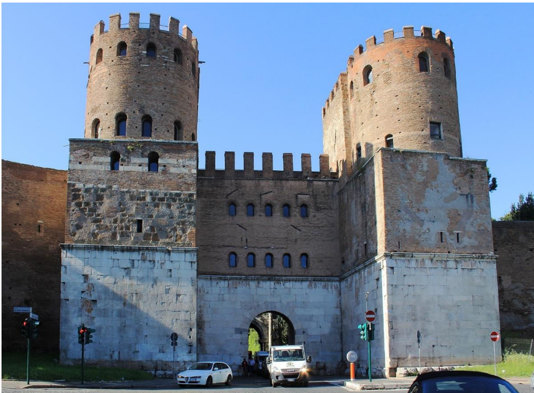
Porta San Sebastiano set fra ydersiden.

Fra slutningen af det 15. århundrede opkaldt efter pilgrimskirken Basilica San Sebastiano med tilhørende katakomber et stykke ude ad Via Appia. Efter sigende var det her, de kristne gemte de jordiske rester af Peter og Paulus, da de to apostle var blevet dræbt som martyrer for deres tro. Porten ligger foran Arco di Druso, som man i mange år mente var en triumfbue, men som formentlig er bygget i det 3. årh. nogle årtier før Den aurelianske Mur som bærepille for en akvædukt, der sikrede vand til Caracallas termer. Buen blev under ombygningen under Honorius forbundet med den foranliggende Porta Appia. Slutstenen over selve porten bærer en græsk indskrift, der takker Gud for hjælp til sejren over goterne i år 403. Men glæden holdt kun i få år, som beskrevet ovenfor.