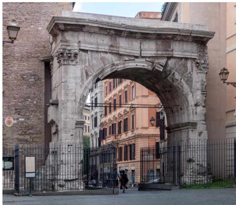
Arcus Gallienus, tidligere Porta Esquilina, i Den servianske Mur.

Den servianske Mur var en vigtig del af Roms forsvar og blev senere forstærket bl.a. under den anden puniske krig (218-201 fvt.), hvor man frygtede, at Hannibal, der drog rundt i Italien med sin hær og sine elefanter, ville angribe Rom: 'Hannibal ad portas!' (d.v.s. Hannibal står ved byens porte). Det gjorde han nu ikke (se nedenfor). Ved den lejlighed blev muren udstyret med katapulter, som romerne brugte til at kaste brændende materialer imod fjenden. Det var jo længe før krudtet blev opfundet. Muren blev igen restaureret under den ødelæggende borgerkrig mellem Marius og Sulla i år 87 f.v.t. Sulla havde tidligere som hærfører for første gang i republikkens historie overtrådt forbuddet mod, at hærførere bragte regulære tropper ind i Rom.