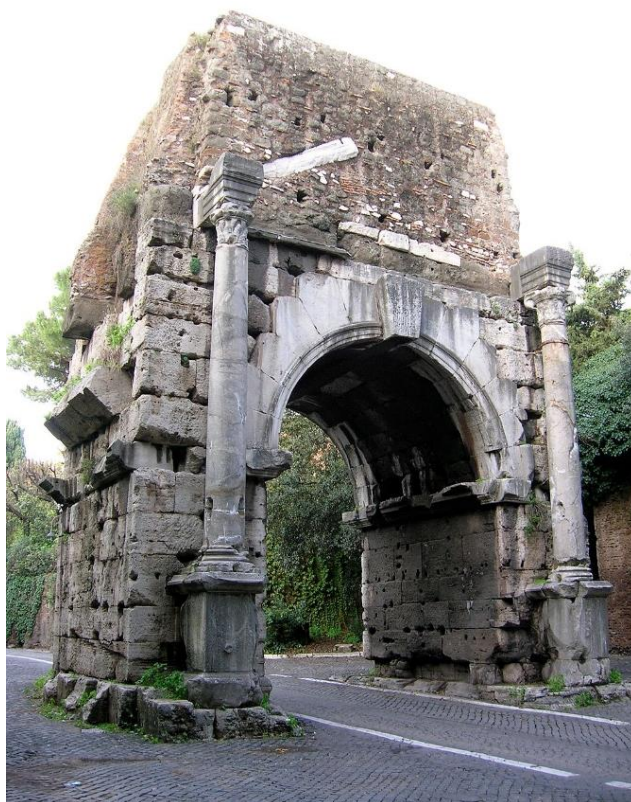
Arco di Druso's facade ud mod Porta San Sebastiano

Lige uden for muren ligger bageren Eurysaces' monument som er beskrevet i et tidligere nyhedsbrev. Monumentet var bygget ind i forsvarsværkerne, hvilket er grunden til den dårlige stand, en del af monumentet er i. Det blev frigjort og genfundet i 1800-tallet, da forsvarsværkerne blev revet ned.