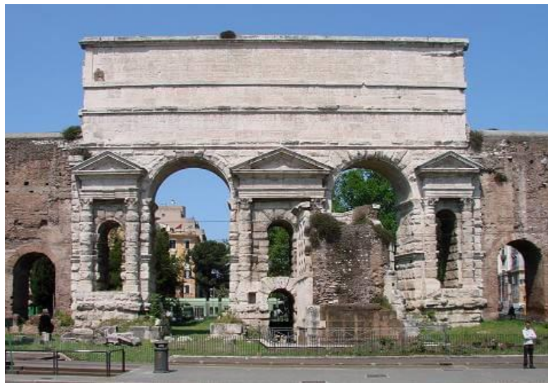
Porta Maggiore

Porten skiftede navn til Porta San Lorenzo i det 8. århundrede, fordi vejen Via Tiburtina førte ud til Basilica di San Lorenzo fuori le Mura, der er en af de 7 pilgrimskirker og viet til Skt. Laurentius. Portens facade udadtil er sen-antik med tårne og vinduer til det rum, hvorfra porten blev lukket. Indad mod byen ses den klassiske antikke port i hvidt marmor. Her kan man stadig på toppen se kanaler, der stammer fra de 3 akvædukter. Porten var i 1347 scene for en kamp mellem Cola di Rienzo's demokratiske militser og adlens tropper. Slaget endte med en sejr til di Rienzo, der advokerede for at fjerne paven's magt og forene Italien. Cola døde siden, overfaldet af pøblen og styrtet ned fra Kapitol, hvor der nu står en statue af ham. Han fik status som ikon 500 år senere under Italiens samling, 'Il Risorgimento'.