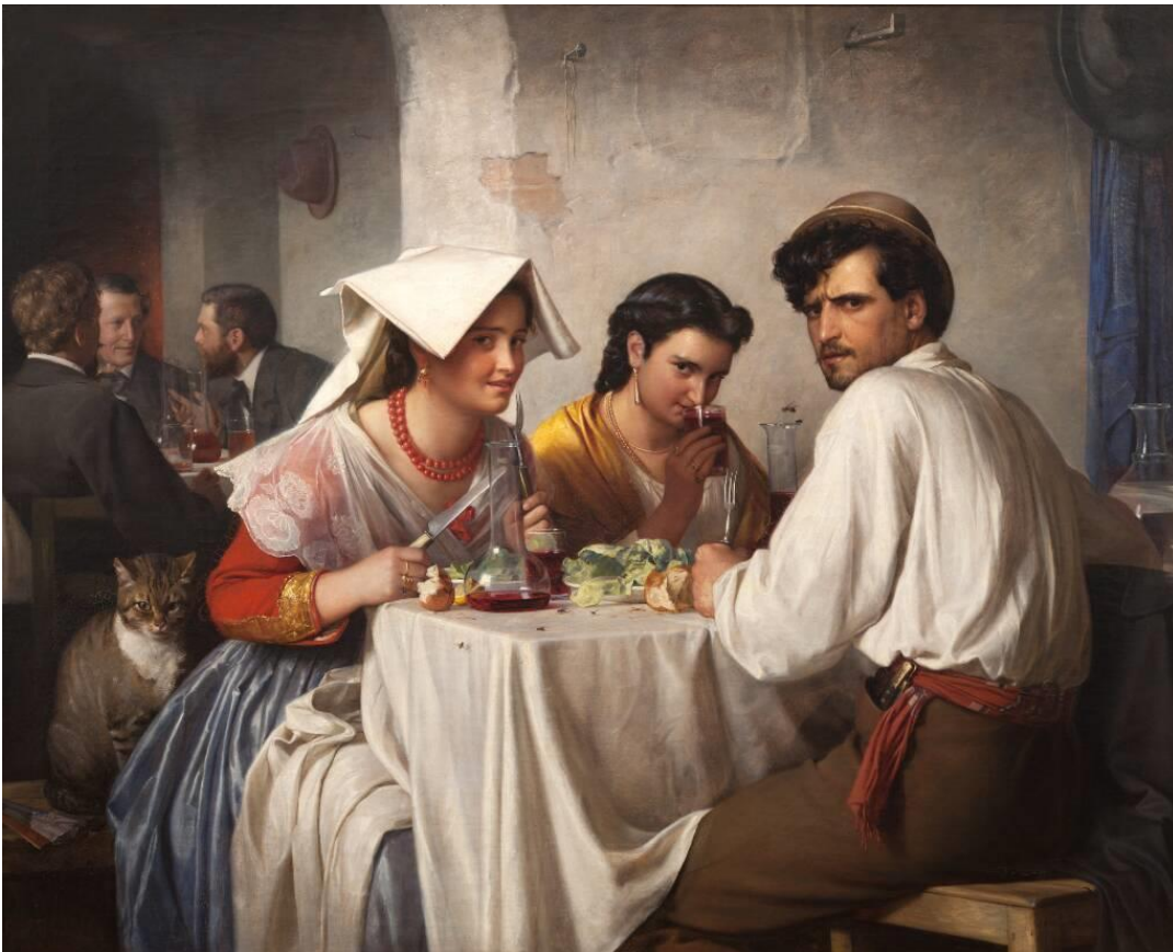
Carl Bloch: Fra et romersk osteria. 1866