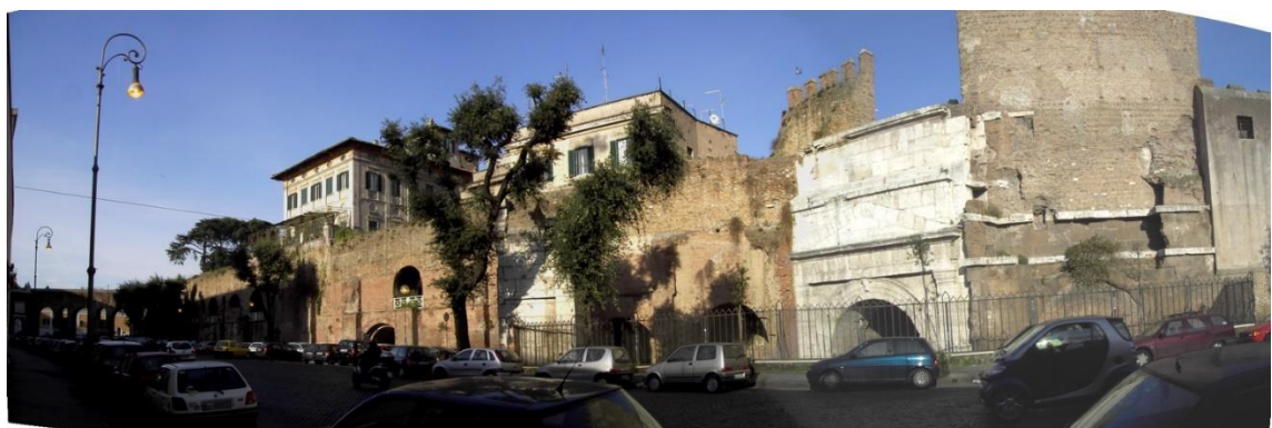
Porta San Lorenzo (Tiburtina)