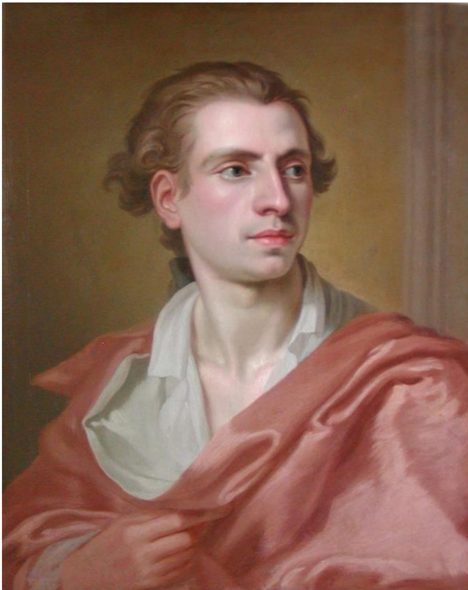
Johannes Wiedewelt portrætteret af Peder Als i Rom i 1758. Billedet introducerede nyklassicismen i dansk kunst med Wiedewelts statelige og fokuserede, næsten heroiske fremtoning. Nu på Frederiksborgmuseet.

Den danske billedhugger Johannes Wiedewelt (1731-1802) blev født i København, hvortil hans farfar var indvandret. Både farfaderen og faderen var også billedhuggere. Wiedewelt var i Rom i 1754-1758, altså en generation før Den danske Guldalder. Her blev han nær ven med Johann Joachim Winckelmann (1717-1768), der som den første påbegyndte arkæologiske studier af antikke skulpturer og derved skabte baggrunden for nyklassicismen.