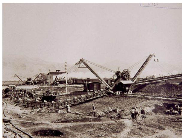
Fra Agro Pontino: storie di bonifica e rinascita enologica - Vinoway.com