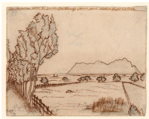
HC Andersen: Pontinske sumpe, Monte Circeo, 1834