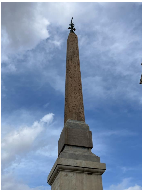
Obeliskene foran SS Trinitá dei Monti over Den spanske Trappe

Obeliskens oprindelige sokkel har en historie helt for sig selv: Den blev liggende og skilt fra obeliskene, da denne blev flyttet fra Villa Ludovisi til Lateran-pladsen. Godt 100 år senere blev soklen fundet og i mangel af bedre anbragt i en cisterne. Man vidste simpelthen ikke, hvad man skulle stille op med den. Men det blev der rådet bod på, da fascistene var kommet til magten: I 1926 blev den indviet på Capitol med Mussolini til stede til minde om Marchen mod Rom og magtovertagelsen i 1922. Med teksten nu som noget nyt på italiensk: 'Denne sten på den kejserlige høj i Rom skal i århundreder minde om det heroiske offer af dem, der faldt for sortskjorternes revolution. 28 oktober år 5'. (År 5 efter fascisternes magtovertagelse. En parallel til pavernes tradition med at angive årstal i forhold til pontifikatets periode). Men monumentet skulle ikke komme til at holde i århundreder, blot i en snes år. Efter fascismens fald blev indskriften fjernet. Men soklen står stadig på Capitol lidt væk fra sin tidligere plads.