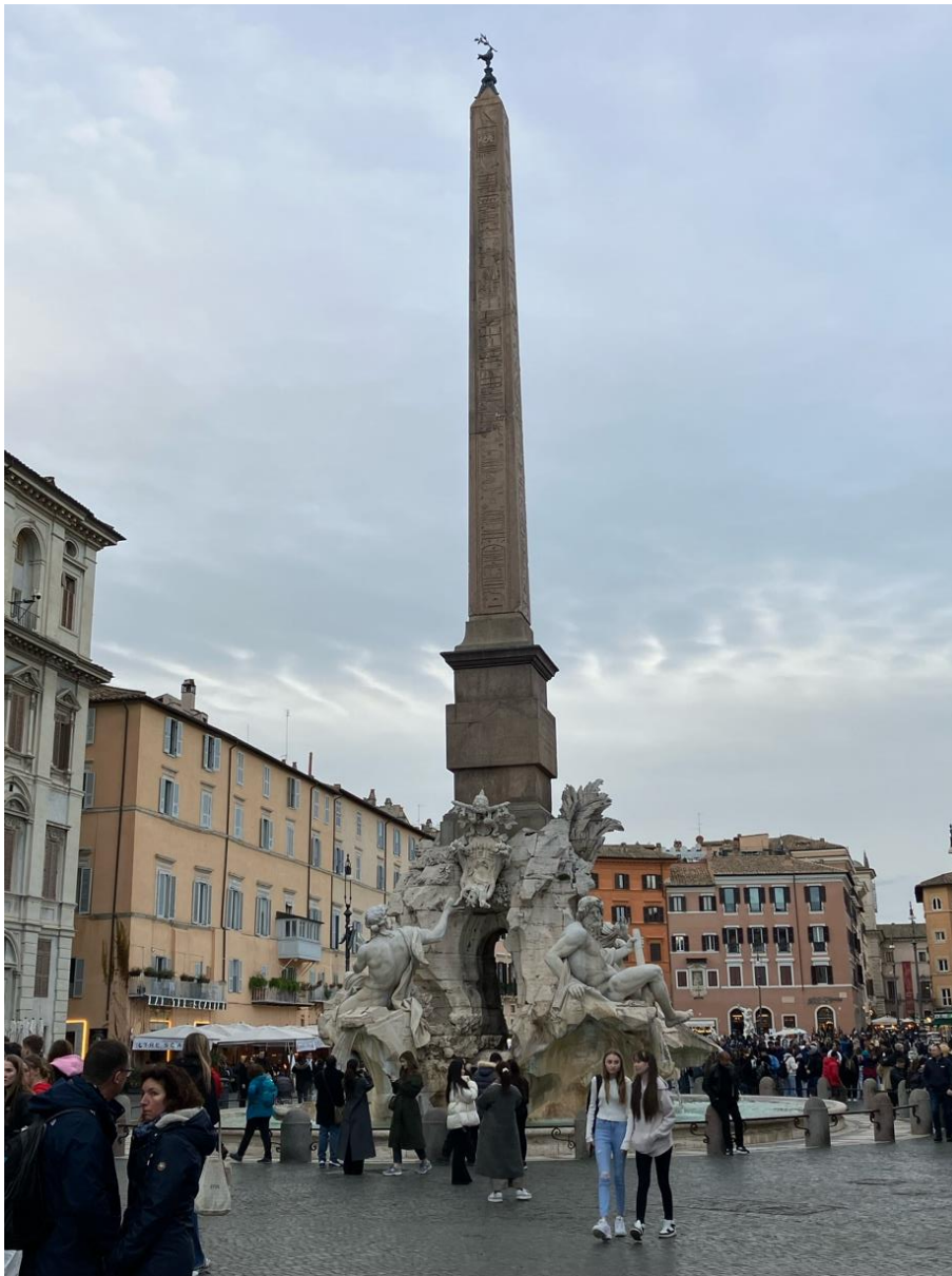
Obelisk over Berninis fontæne med de tre floder på Piazza Navona lige overfor Palazzo Pamphilij pavenes fødested, der nu huser den brasilianske ambassade

Obelisk blev muligvis genfundet allerede kort efter at paverne vendte hjem fra Avignon, da Santa Maria sopra Minerva skulle have en ny apsis i 1374. Nogen tid efter lå den i stykker ved den nærliggende kirke San Macuto opkaldt efter en helgen fra Bretagne (Saint Maló). Denne kirke var ligesom Santa Maria sopra Minerva ejet af dominikaner-ordenen. Måske var obelisk blot lagt til side, men i 1448 skal den være blevet rejst samme sted. Men man ved ikke, hvem der har flyttet den og siden rejst den.