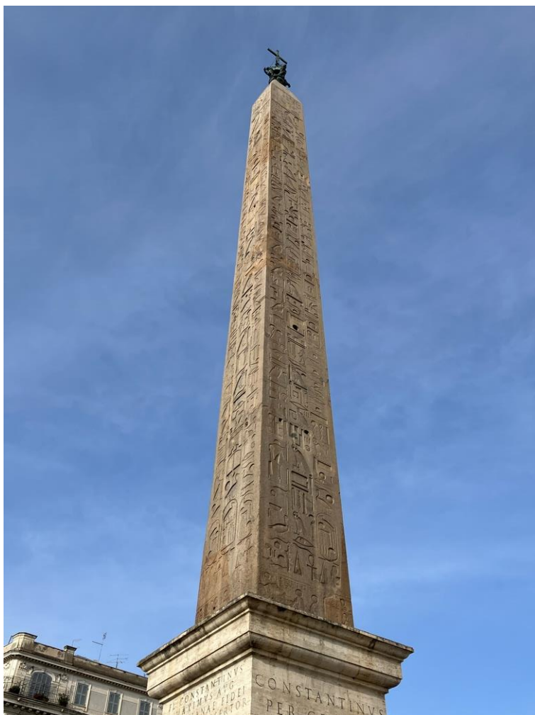
Obeliskens ved Lateran-paladset

Man vidste fra skriftlige kilder, at der skulle ligge to obelisker på Circus Maximus, dels Konstantius', dels Augustus' allerførste obelisk i Rom. De blev faktisk begge fundet med få dages mellemrum i 1587, efter at pave Sixtus V (1585-1590) havde udlovet en dusør. Men let har det ikke været: Konstantius' obelisk lå mere end 5 m under jordoverfladen.