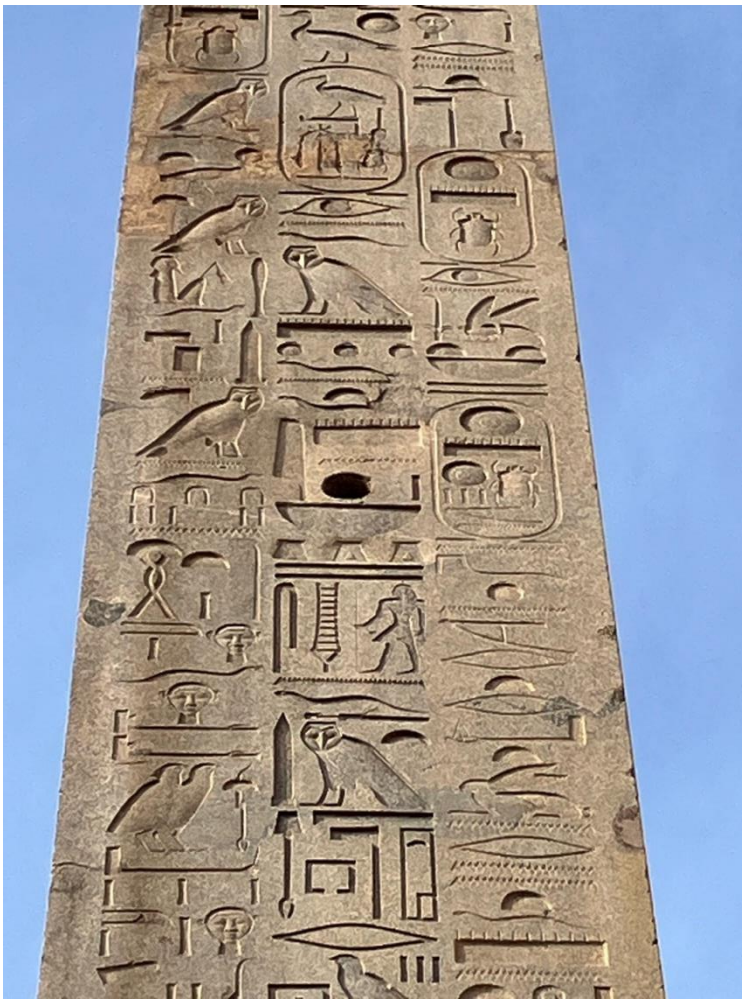
Obeliskens ved Lateranet. Muligvis repræsenterer området med hullet midt i billedet et af de steder, hvor Amons navn blev fjernet under Akhenaton og genindskrevet under Ramses II