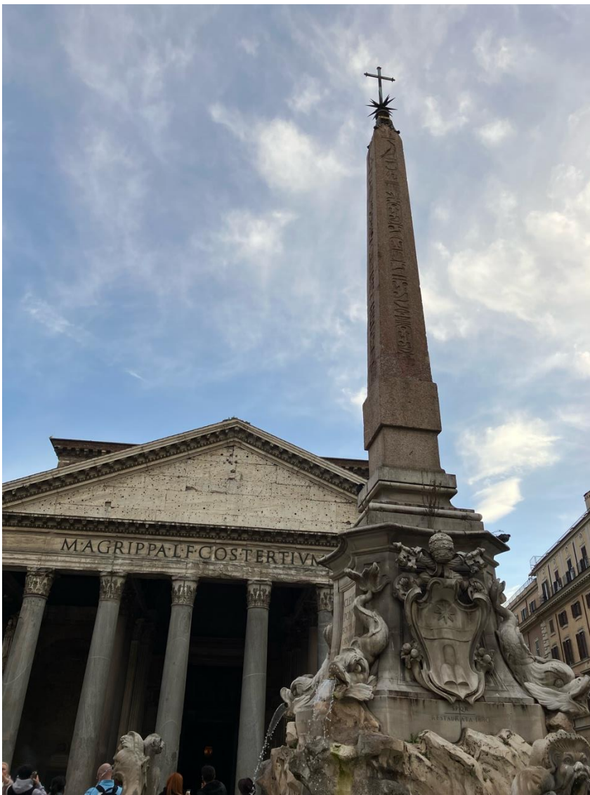
Obelisk foran Pantheon med de vandspyende delfiner og dæmoner